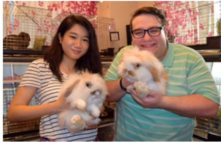
ウサギを抱いて記念撮影する外国人客(右)。日本の友人と来店した=台東区

「うさぎカフェ」に「鳥カフェ」。動物と触れ合える浅草のカフェが人気だ。インターネットや口コミで広まり、店を目当てに浅草にやって来る外国人観光客も多いとか。動物たちと来店客に会いに行った。